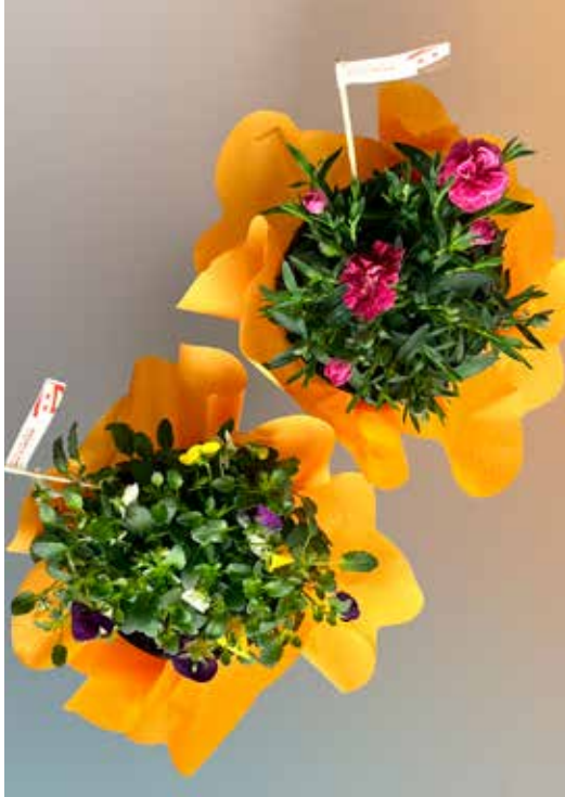
PIANTINE FIORI COLORATI DONAZIONE MINIMA € 5,00