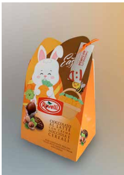
CIOCCOLATINI ROVELLI DONAZIONE MINIMA € 10,00