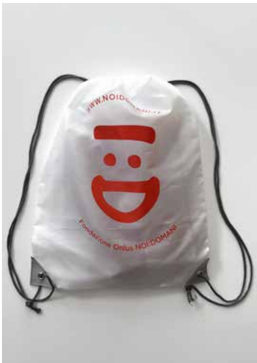
ZAINETTI DONAZIONE MINIMA € 5,00

*importo relativo a ordine minimo di 10 pezzi