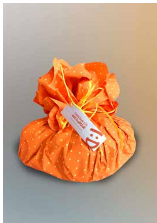
COLOMBA DI PASQUA DONAZIONE MINIMA € 15,00

Alcuni prodotti possono essere personalizzati in collaborazione con i ragazzi dei centri educativi per disabili.