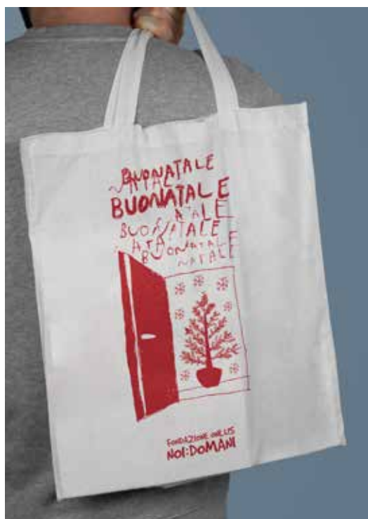
SHOPPER DONAZIONE MINIMA € 7,00