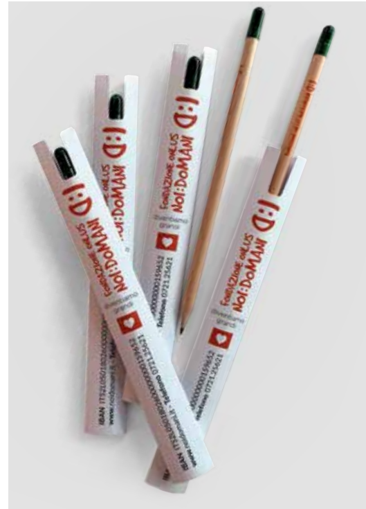
MATITE CON SEMI DONAZIONE MINIMA € 2,50*

*importo relativo a ordine minimo di 10 pezzi