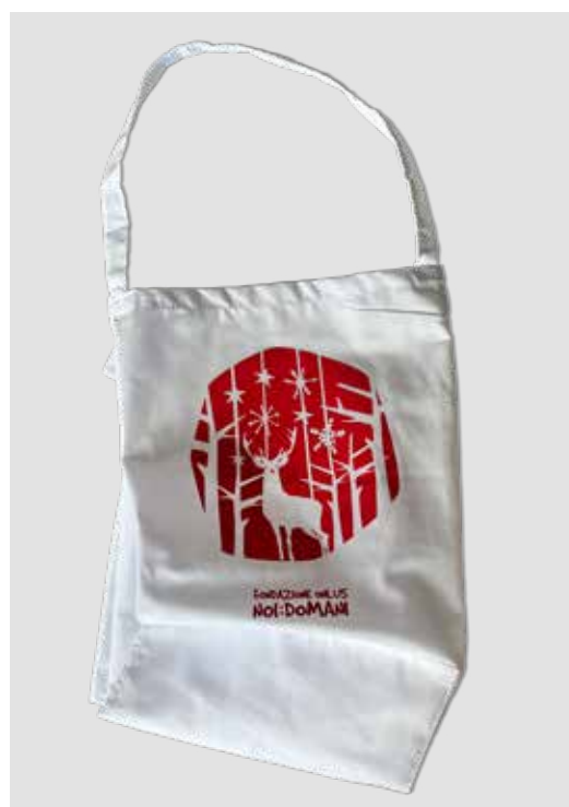
GREMBIULI DONAZIONE MINIMA € 10,00

Alcuni prodotti possono essere personalizzati in collaborazione con i ragazzi dei centri educativi per disabili.