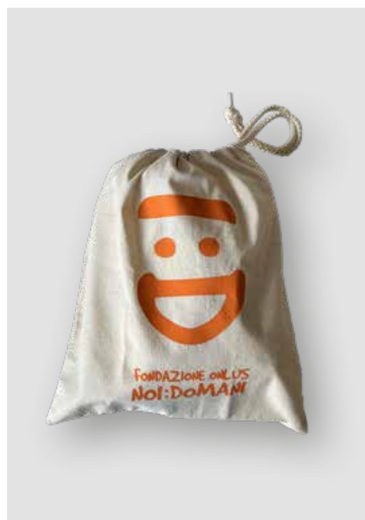
SACCHE DI STOFFA PICCOLE DONAZIONE MINIMA € 5,00

Alcuni prodotti possono essere personalizzati in collaborazione con i ragazzi dei centri educativi per disabili.