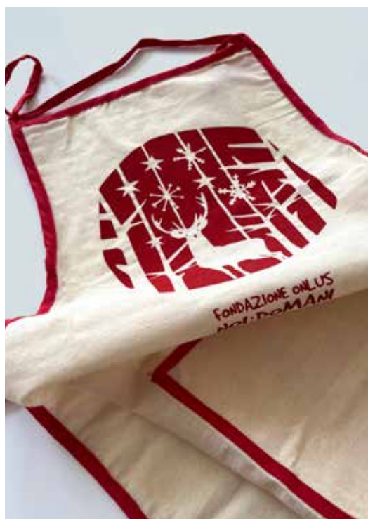
GREMBIULI DONAZIONE MINIMA € 10,00