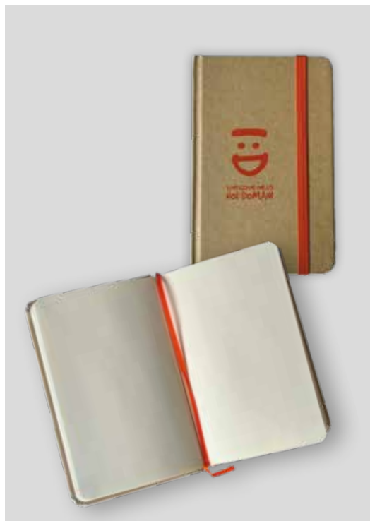
BLOCCONOTES DONAZIONE MINIMA € 5,00