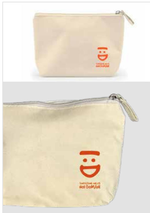
ASTUCCI DONAZIONE MINIMA € 7,00