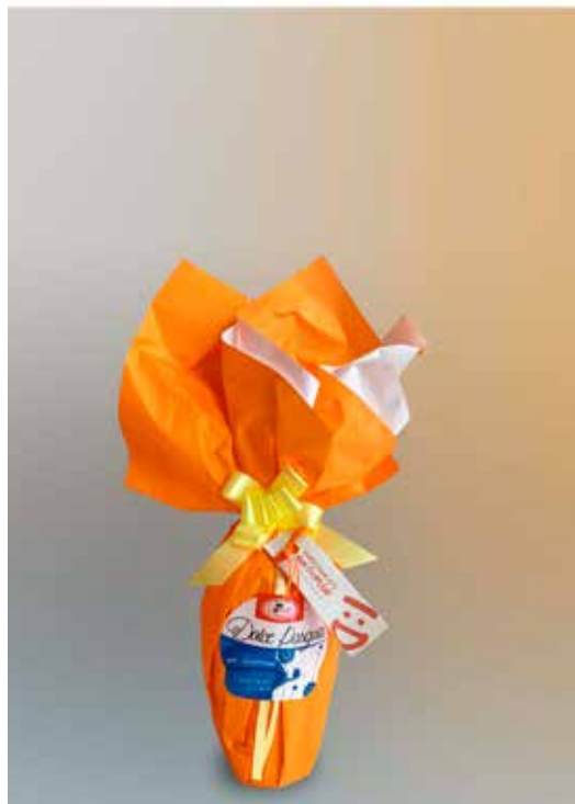
UOVO DI PASQUA PICCOLO DONAZIONE MINIMA € 5,00