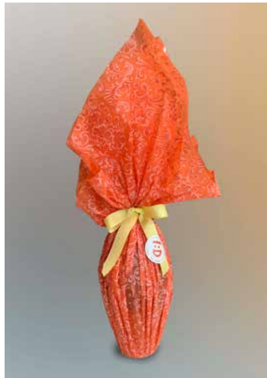
UOVO DI PASQUA GRANDE DONAZIONE MINIMA € 15,00