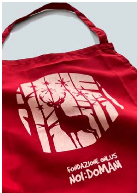
GREMBIULI DONAZIONE MINIMA € 10,00