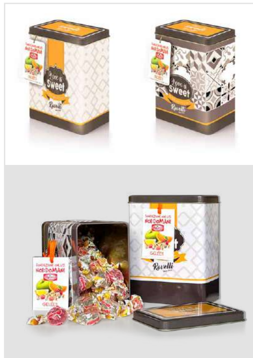
LATTINE CARMELLE ROVELLI DONAZIONE MINIMA € 12,00