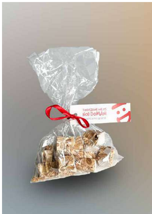
TORRONCINI BAR ROMEO DONAZIONE MINIMA € 10,00