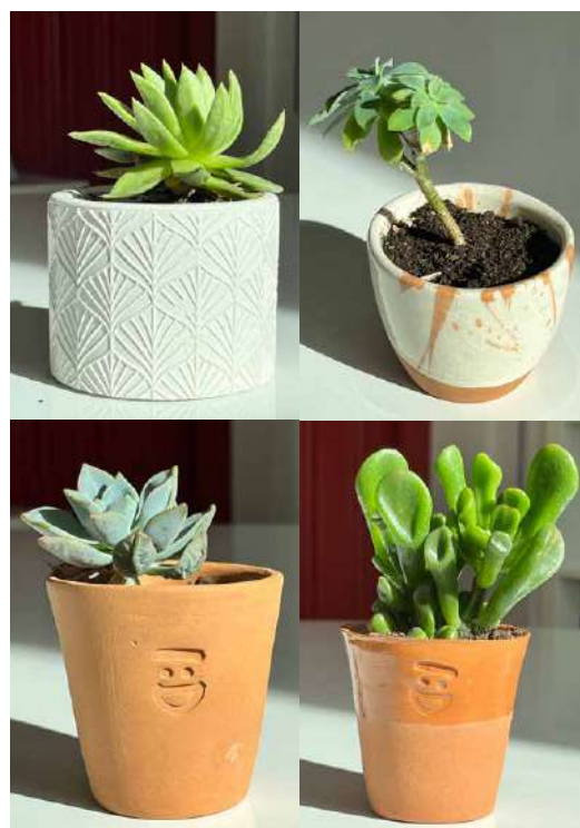
PIANTINE DONAZIONE MINIMA € 5,00 - 15,00

Alcuni prodotti possono essere personalizzati in collaborazione con i ragazzi dei centri educativi per disabili.