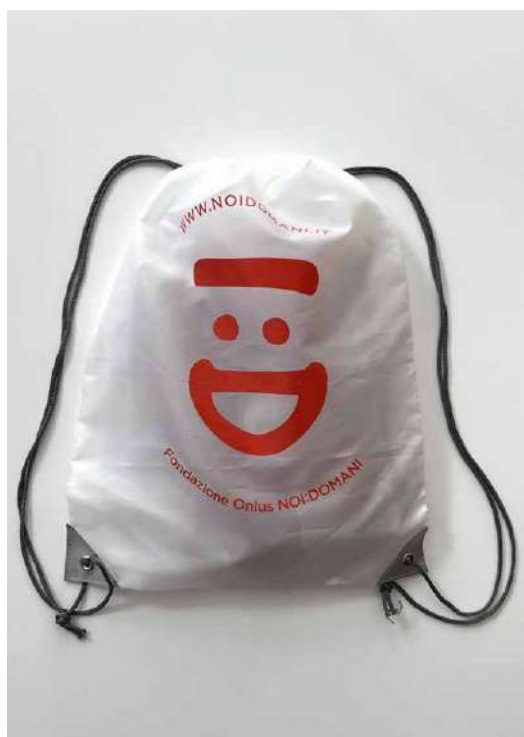
ZAINETTI DONAZIONE MINIMA € 5,00