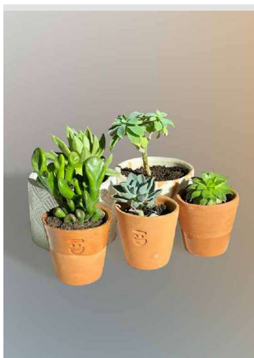
PIANTINE DONAZIONE MINIMA € 5,00 - 15,00