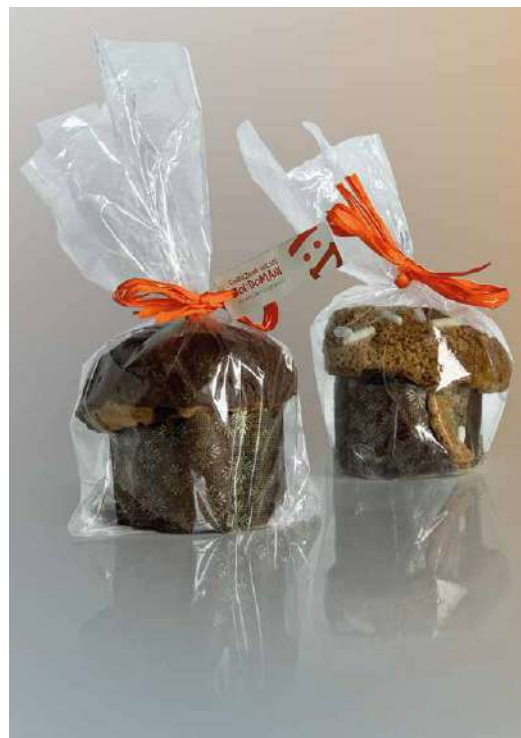
PANETTONE ARTIGIANALE DONAZIONE MINIMA € 25,00