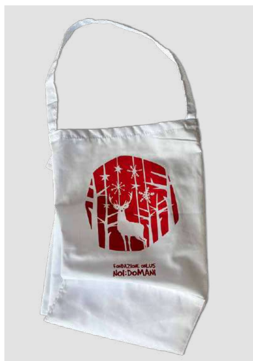
GREMBIULI DONAZIONE MINIMA € 10,00

Alcuni prodotti possono essere personalizzati in collaborazione con i ragazzi dei centri educativi per disabili.