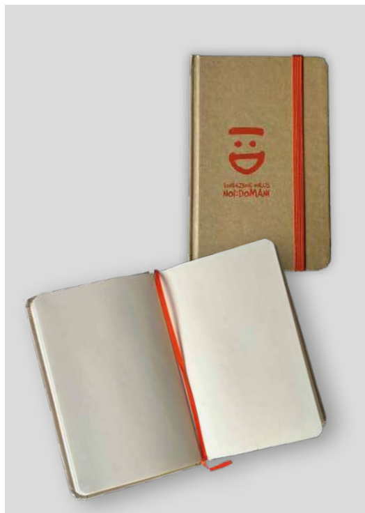
BLOCCONOTES DONAZIONE MINIMA € 5,00