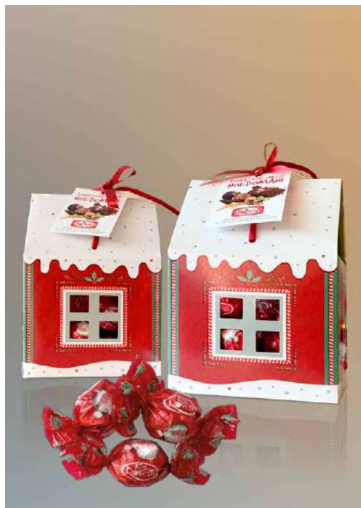
CASSETTE CIOCCOLATINI ROVELLI DONAZIONE MINIMA € 15,00