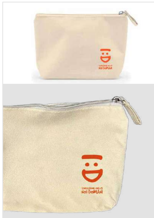
ASTUCCI DONAZIONE MINIMA € 7,00