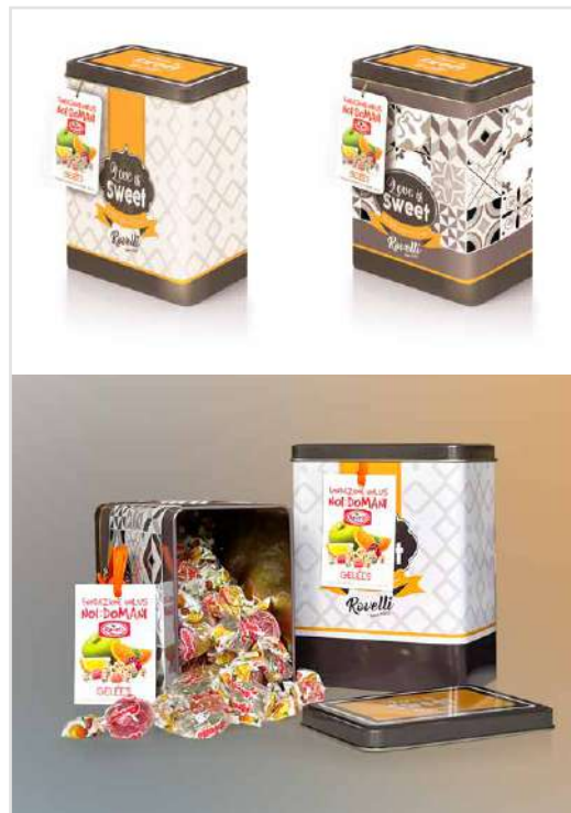
LATTINE CARMELLE ROVELLI DONAZIONE MINIMA € 12,00