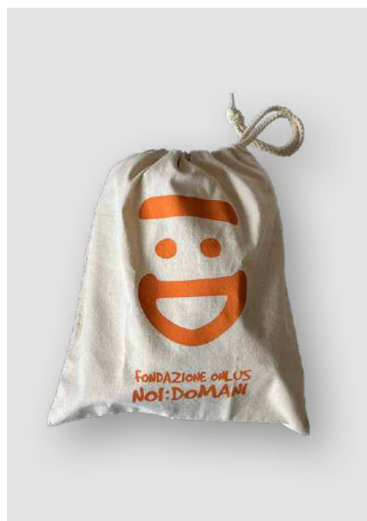
SACCHE DI STOFFA PICCOLE DONAZIONE MINIMA € 5,00

Alcuni prodotti possono essere personalizzati in collaborazione con i ragazzi dei centri educativi per disabili.