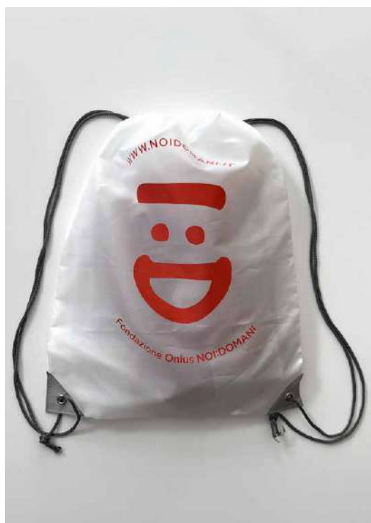
ZAINETTI DONAZIONE MINIMA € 5,00