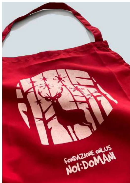
GREMBIULI DONAZIONE MINIMA € 10,00