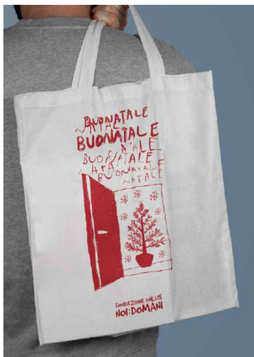
SHOPPER DONAZIONE MINIMA € 7,00

Alcuni prodotti possono essere personalizzati in collaborazione con i ragazzi dei centri educativi per disabili.