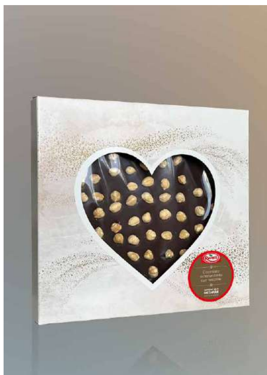
CIOCCOLATO NOCCIOLE FOND. DONAZIONE MINIMA € 15,00