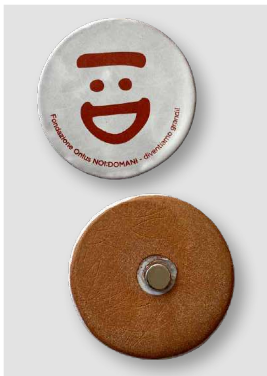
CALAMITE GRANDI DONAZIONE MINIMA € 5,00