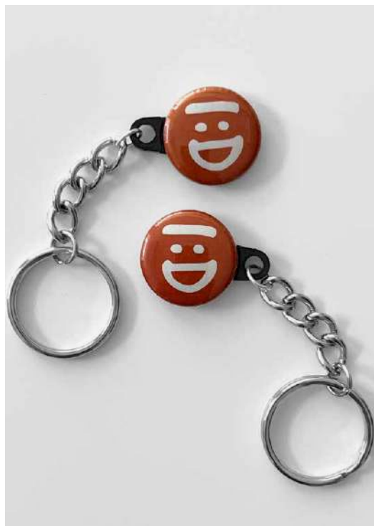
PORTACHIAVI DONAZIONE MINIMA € 2,00