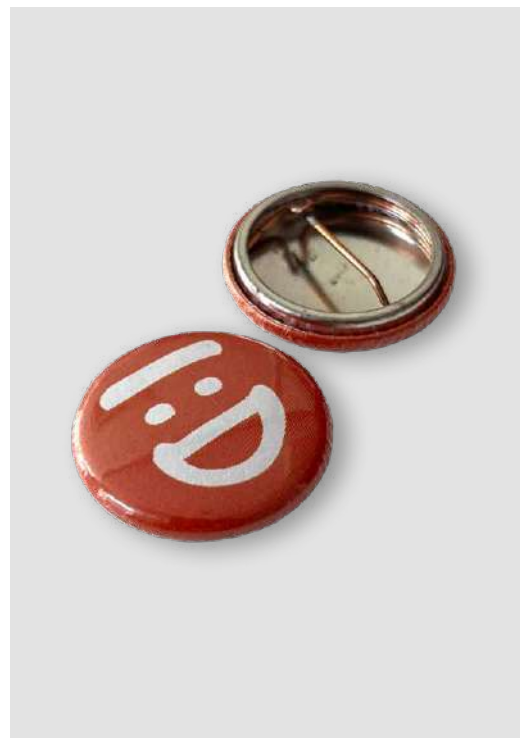
SPILLETTE DONAZIONE MINIMA € 2,00