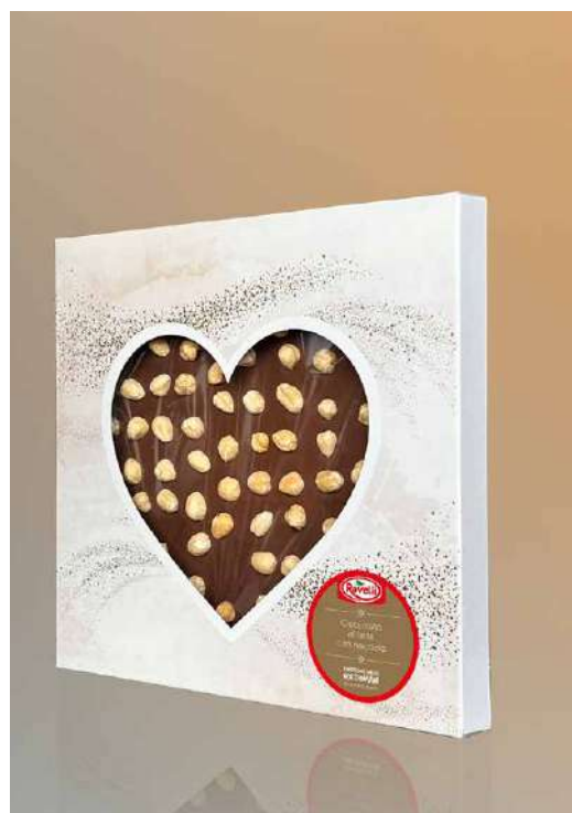
CIOCCOLATO NOCCIOLE LATTE DONAZIONE MINIMA € 15,00

Alcuni prodotti possono essere personalizzati in collaborazione con i ragazzi dei centri educativi per disabili.