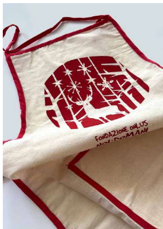
GREMBIULI DONAZIONE MINIMA € 10,00