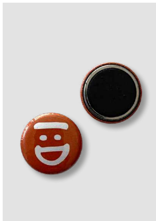
CALAMITE PICCOLE DONAZIONE MINIMA € 2,00

Alcuni prodotti possono essere personalizzati in collaborazione con i ragazzi dei centri educativi per disabili.